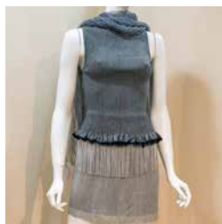
New techniques to renovate traditional weaving techniques